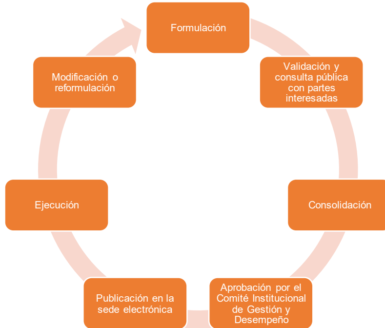
Ilustración 3. Ciclo del PTEP