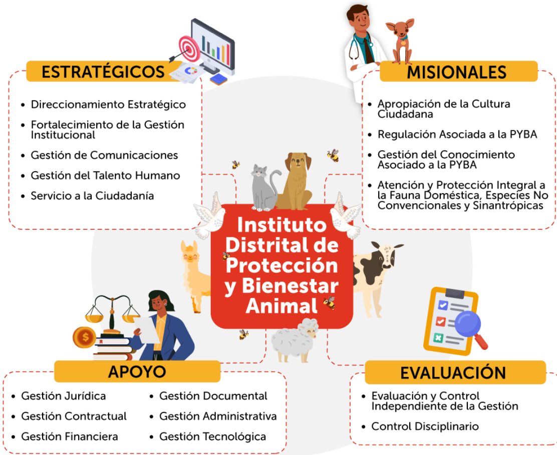
Ilustración 1 Mapa de procesos IDPYBA